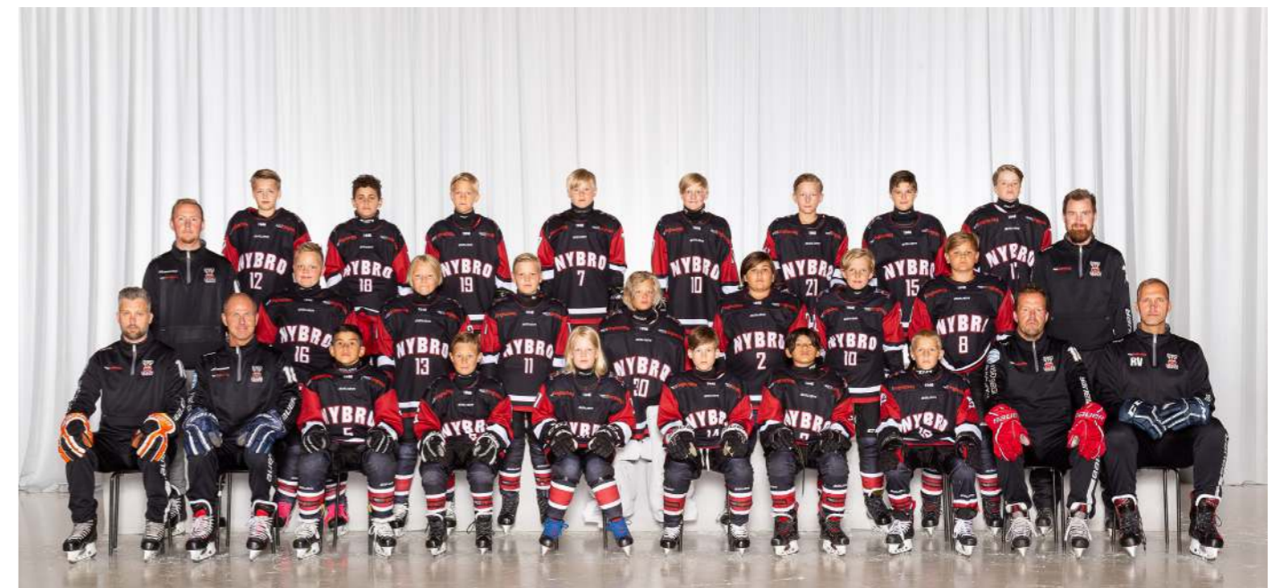
Nybro Vikings C-Grupp Säsongen 2020-2021