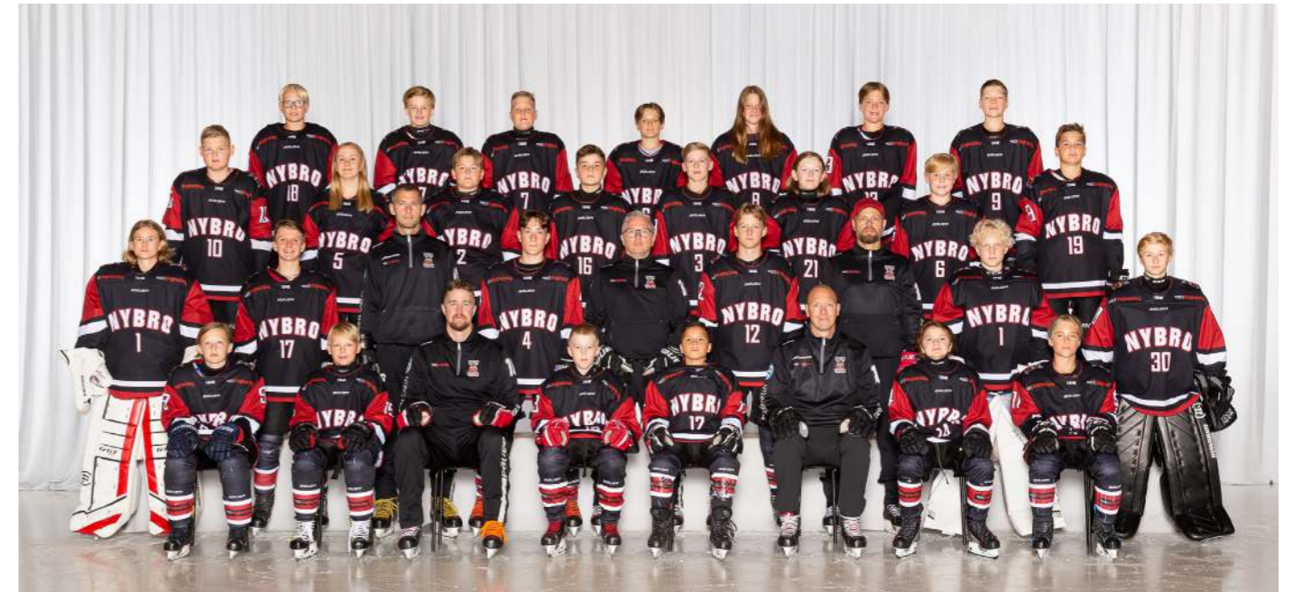
Nybro Vikings B-Grupp Säsongen 2020-2021