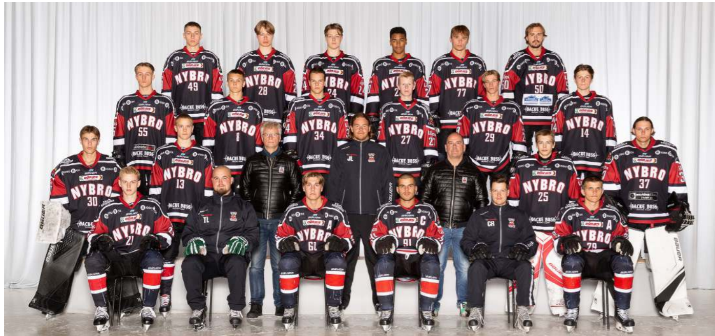
Nybro Vikings Junior Säsongen 2020-2021