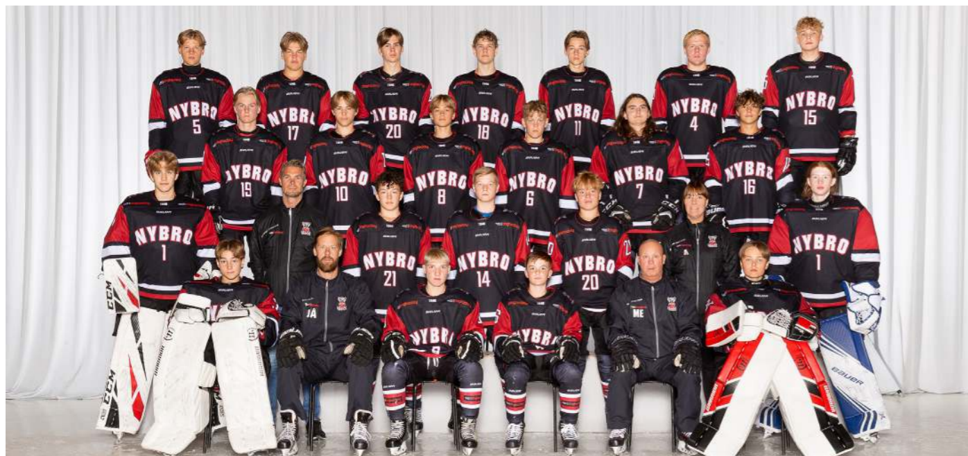
Nybro Vikings A-Grupp Säsongen 2020-2021