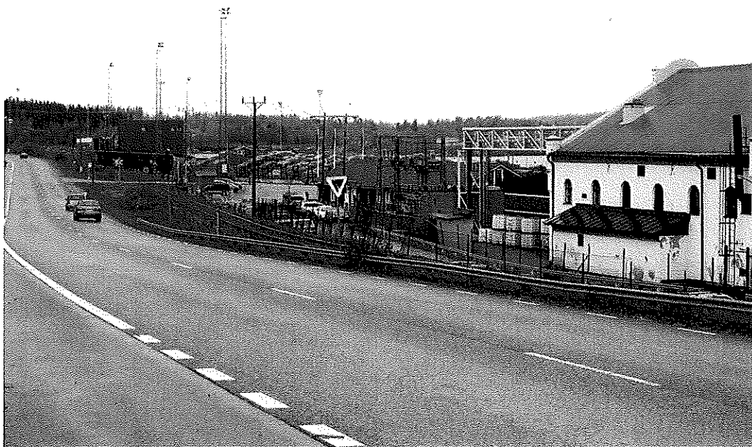
Bild från 2006. Ishockeyrinken som anlades 1952, var belägen ungefär vid den låga byggnaden mitt i bilden mellan den gamla sågverksbyggnaden och timmerlagret.